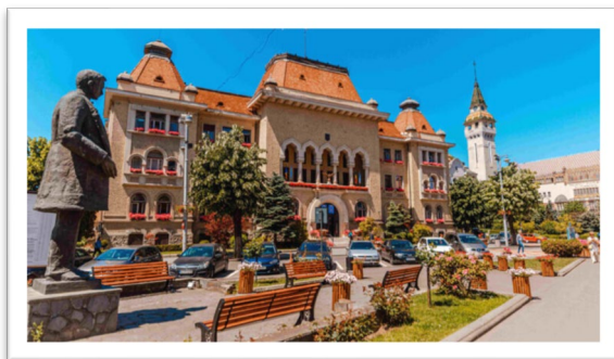
Primăria și Prefectura

Distanța dintre aeroport și centrul orașului se parcurge în aproximativ 15 minute (12 km). Traversarea pârâului Poklos, cunoscut drept „Pârâul Iadului”, marchează pătrunderea în zona centrală. Piața centrală, aflată pe vechea albie a râului, a fost inițial loc de comerț, transformându-se ulterior într-un ansamblu arhitectural reprezentativ pentru începutul secolului XX. Un prim reper este Catedrala „Bunavestire”, edificată între 1926 și 1936, inspirată de Bazilica Sfântul Petru. Lăcașul a aparținut până în 1948 cultului greco-catolic. În apropiere se află clădirea Prefecturii, ridicată în 1907 în stil secesion, cu un interior inspirat de Castelul Corvinilor.