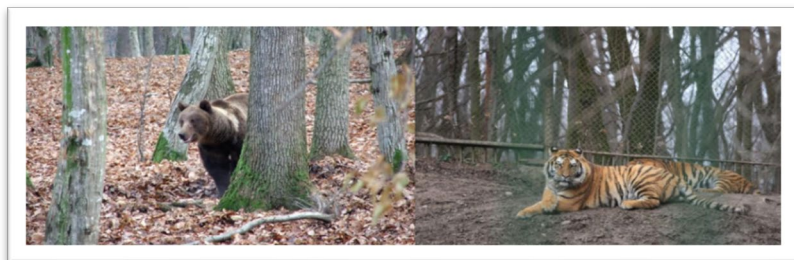
Grădina Zoologică Târgu Mureș

Târgu Mureș ilustrează armonia dintre patrimoniu și modernitate. Pe Platoul Cornești, la 488 m altitudine, se află o zonă de agrement apreciată, iar Grădina Zoologică Târgu Mureș este una dintre cele mai mari din România, amplasată în pădure.