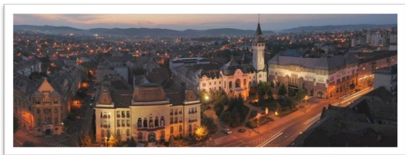
Primăria, Prefectura și Palatul Culturii

venețiene, iar sala de concerte dispune de o orgă cu 4463 de tuburi.