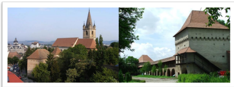
Cetatea medievală târgumureșeană

Deasupra orașului se înalță Cetatea medievală din Târgu Mureș, cu cele șapte bastioane ridicate între 1602 și 1652. În interior se află Biserica Reformată din Cetate, loc al unor importante evenimente istorice, inclusiv proclamarea libertății religioase în 1571 și încoronarea lui Francisc Rákóczi al II-lea în 1704.