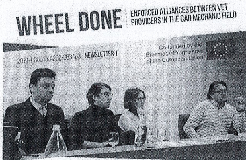
On the 2nd and 3rd of December the first transnational meeting of WHEEL DONE project was held in Madrid

Obiectivele proiectului sunt: crearea oportunităților de învățare de calitate pentru elevi cu focus către transferul pe piața muncii, dezvoltarea parteneriatului școală–firmă–societate civilă (ONG) la nivel local, creșterea nivelului de pregătire al profesorilor și tutorilor de practică, dezvoltarea unui program de consiliere în carieră la care elevii să aibă acces din perioada studiilor, reducerea abandonului școlar și creșterea gradului de ocupare al elevilor la finalizarea studiilor, reducerea decalajului dintre nivelul de transmitere a informației în școală (teorie și practică) și progresul tehnologic în domeniul mecanicii auto.